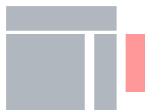
Skyscraper 160 x 600