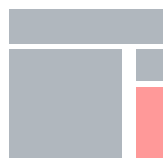
Rectangle 1300 x 250