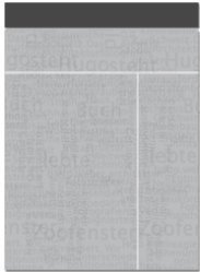
Superbanner oder Billboard