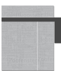
Hockeystick, Wallpaper oder Tandem-Ad