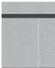
Hockeystick, Wallpaper oder Tandem-Ad