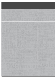
Superbanner oder Billboard