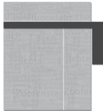
Hockeystick, wallpaper or tandem-ad